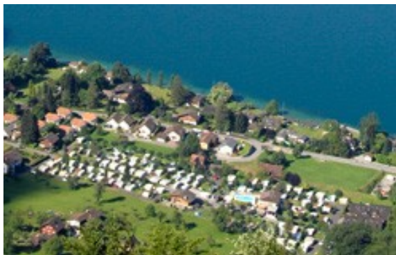
das Ferienparadies am Vierwaldstättersee!

So finden sie uns auch im Web: www.camping-vitznau.ch