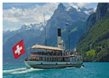
Dampfschiff auf dem Vier- waldstättersee

Das könnte bald auch ihr Slogan werden: „Wohnen wo andere Urlaub machen“